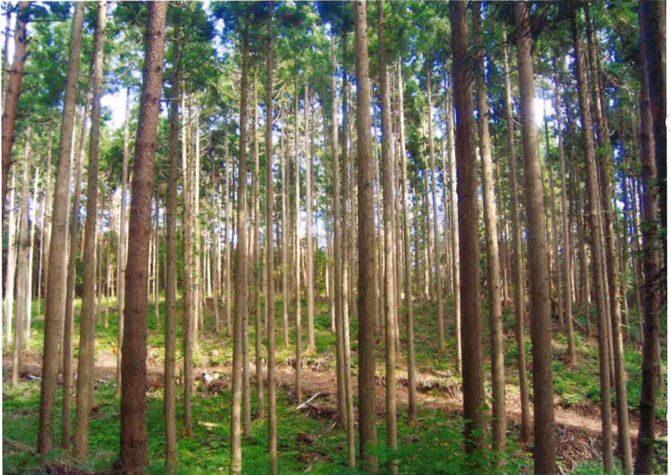
適切な間伐を実施した美林（遊佐町直世地内）

本 所 999-6711 酒田市飛鳥字大林547-1 TEL 0234-52-2788 FAX 0234-52-2789 酒田支所 998-0112 酒田市浜中字八間山858-76 TEL 0234-92-2256 FAX 0234-92-4526