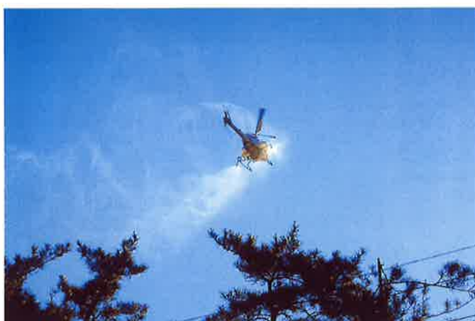
無人ラジヘリ薬剤散布（遊佐町菅里地内）